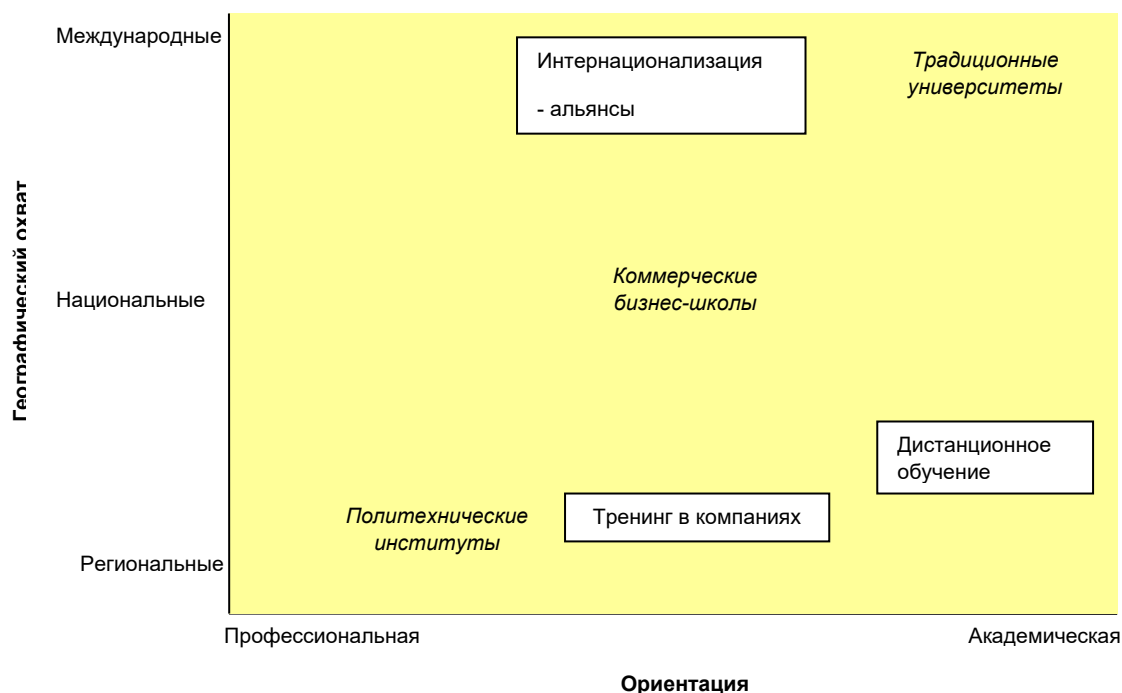
Рис. 3. «Стратегические пустоты»